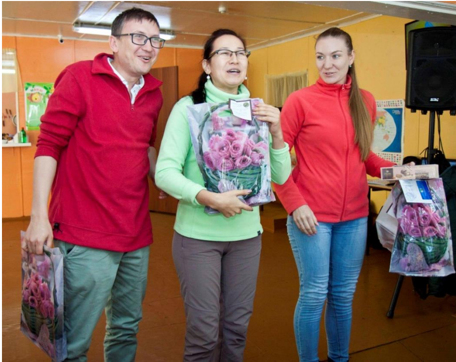
Поздравление с профессиональным праздником «День учителя»