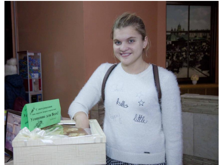
День рождения Дворца творчества