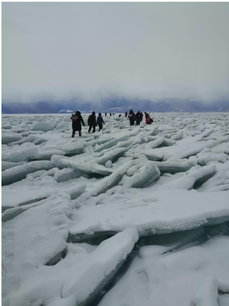
Ледовый переход работников образования