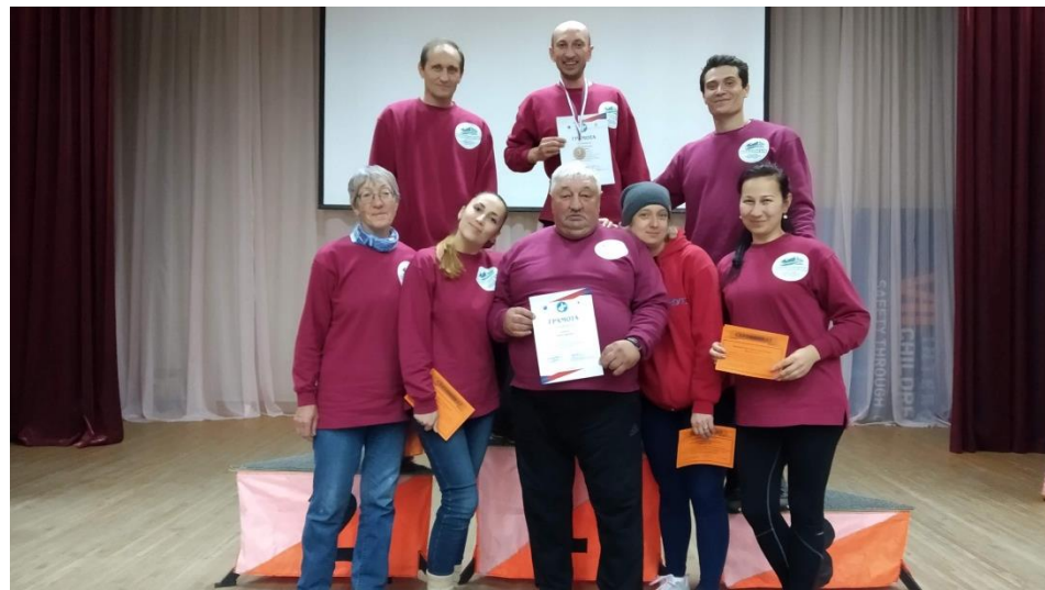
Областной турслёт (1 место «Визитка»)