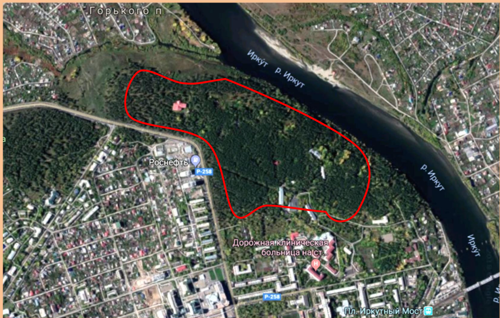
СХЕМА РАСПОЛОЖЕНИЯ ПАМЯТНИКА ПРИРОДЫ РЕГИОНАЛЬНОГО ЗНАЧЕНИЯ «КАЙСКИЙ БОР»