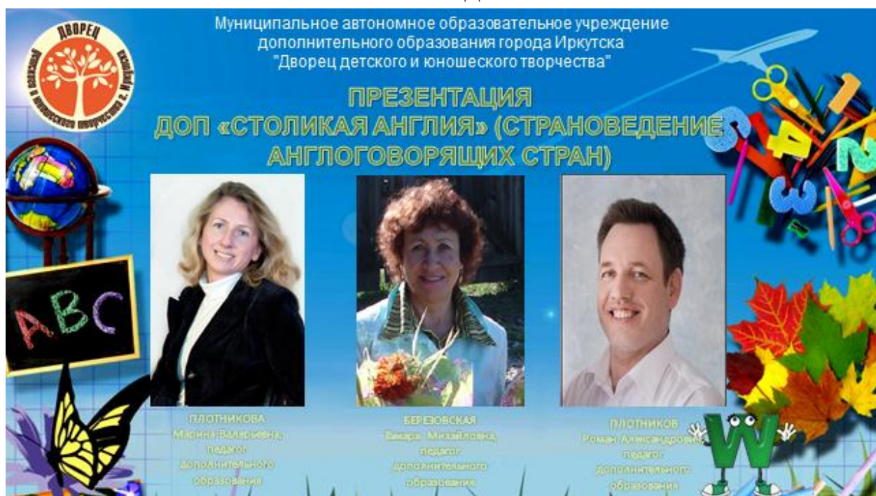
ФОТО УЧЕБНОЙ ДЕЯТЕЛЬНОСТИ