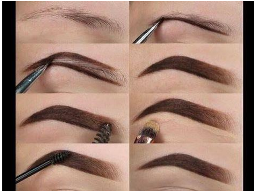
Рис. 2 Коррекция бровей