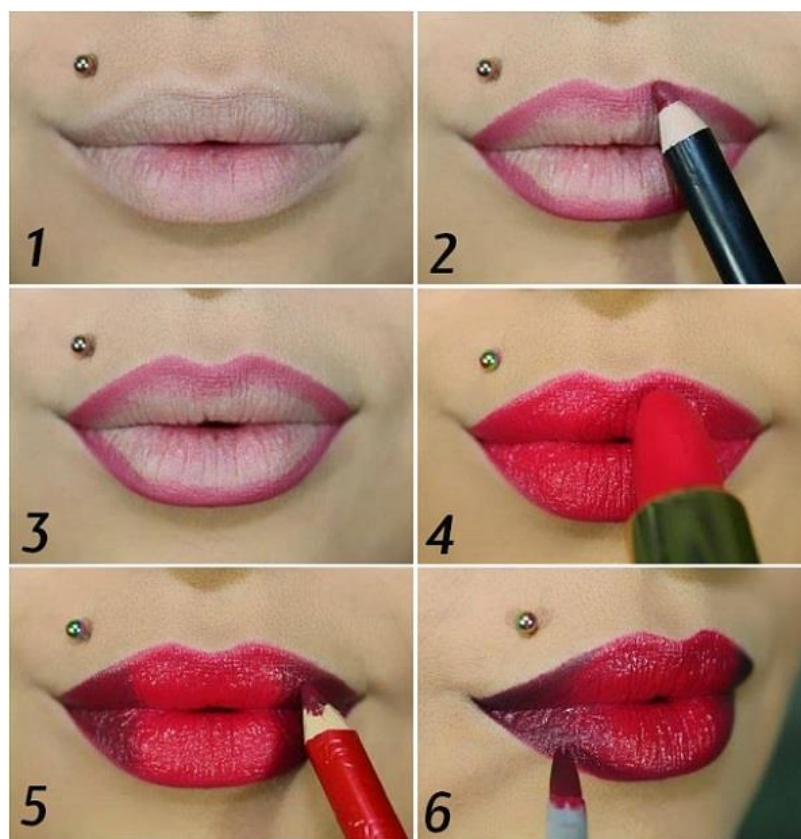
Рис.6 Макияж губ