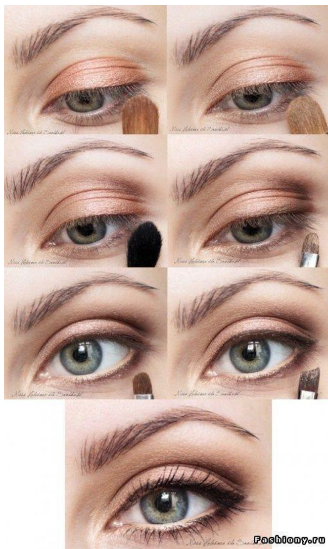
Рис.3 Макияж глаз (мягкий контур)