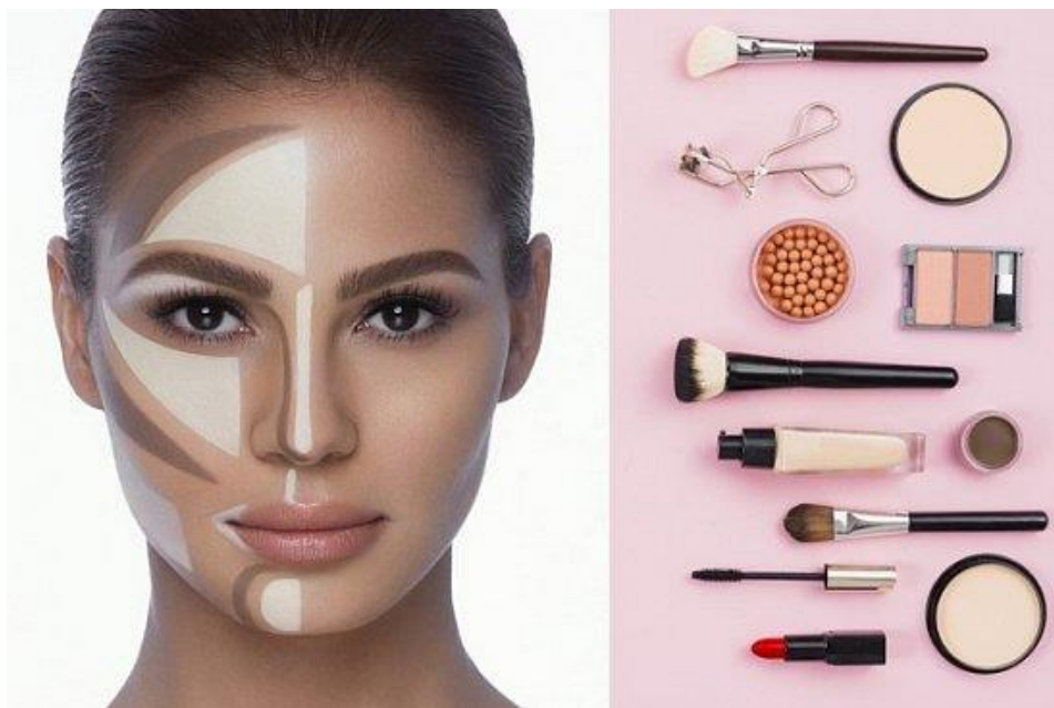
Рис. 1 Моделирование лица