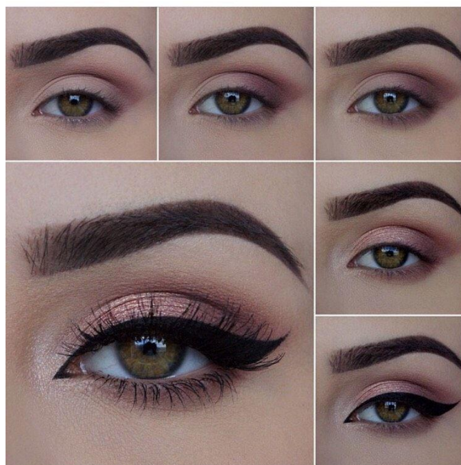
Рис.4 Использование подводки для создания контура