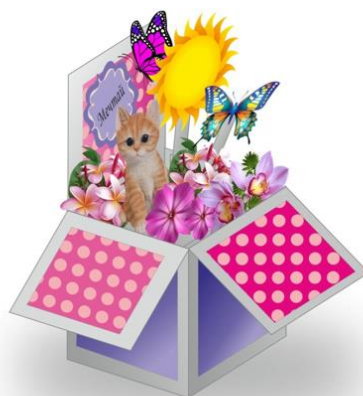
Коробочку можно сложить в плоский вариант