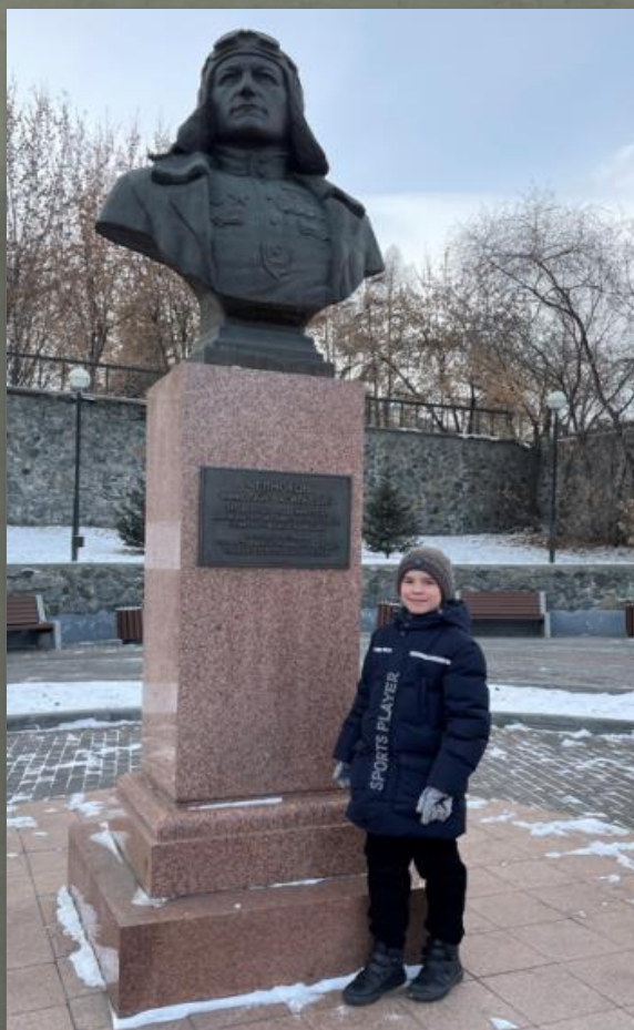
ПАМЯТНИК ДВАЖДЫ ГЕРОЮ СОВЕТСКОГО СОЮЗА НИКОЛАЮ ЧЕЛНКОВУ