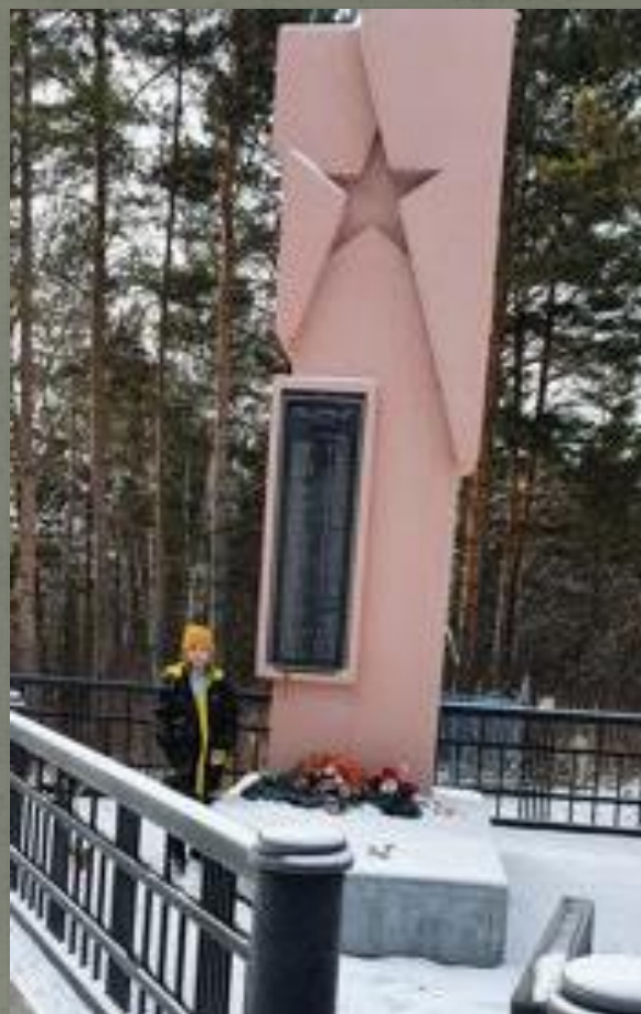
СТЕЛА УЧАСТНИКАМ ВЕЛИКОЙ ОТЕЧЕСТВЕННОЙ ВОЙНЫ УМЕРШИМ ОТ РАН В ГОСПИТАЛЯХ Г. ИРКУТСКА 1941-1945 ГГ.