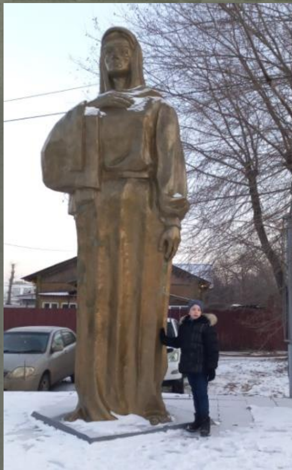
МЕМОРИАЛ РАБОТНИКАМ ЛОКОМОТИВНОГО ДЕПО, ПОГИБШИМ В ГОДЫ ВЕЛИКОЙ ОТЕЧЕСТВЕННОЙ ВОЙНЫ