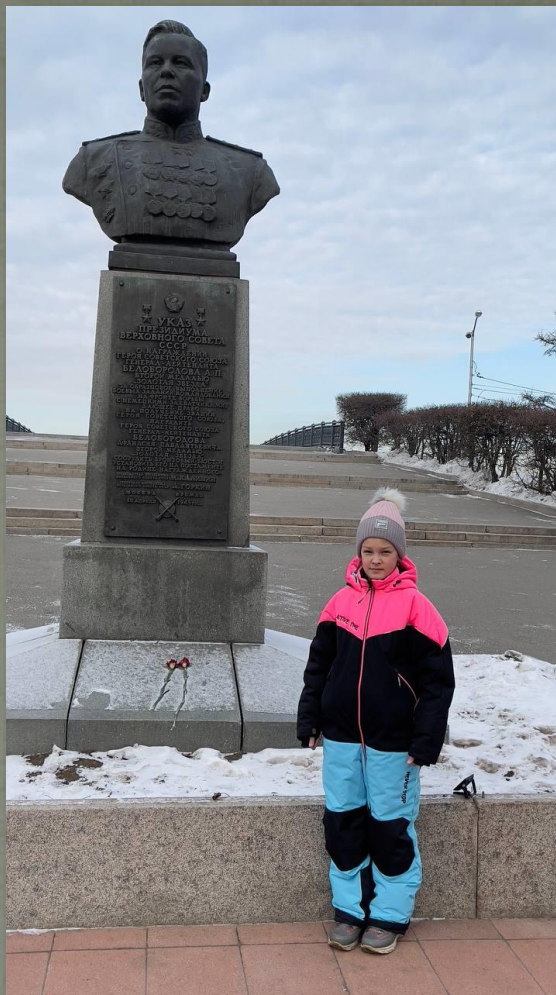
ПАМЯТНИК ГЕНЕРАЛУ АРМИИ А.П. БЕЛОБОРОДОВУ