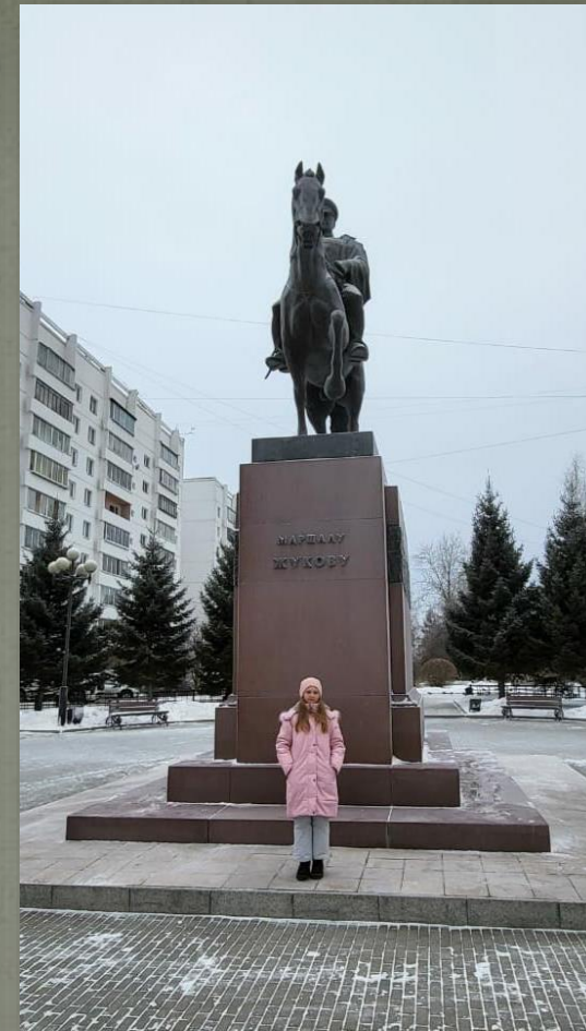
ПАМЯТНИК МАРШАЛУ СОВЕТСКОГО СОЮЗА Г.К. ЖУКОВУ