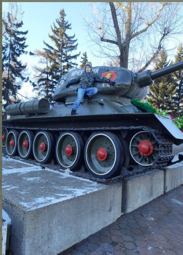
ТАНК «ИРКУТСКИЙ КОМСОМОЛЕЦ»