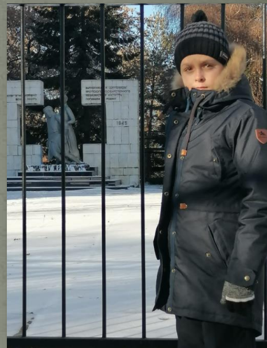
ПАМЯТНИК ВРАЧАМ И МЕДСЕСТРАМ, ПОГИБШИМ В ГОДЫ ВЕЛИКОЙ ОТЕЧЕСТВЕННОЙ ВОЙНЫ