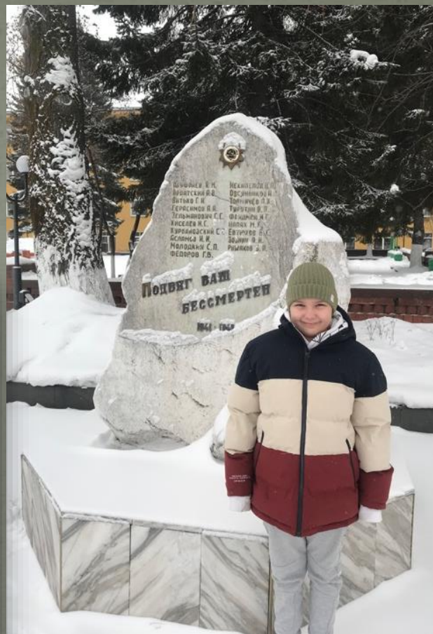
МЕМОРИАЛ ПРЕПОДАВАТЕЛЯМ И СТУДЕНТАМ ИСХИ, ПОГИБШИМ В ГОДЫ ВЕЛИКОЙ ОТЕЧЕСТВЕННОЙ ВОЙНЫ