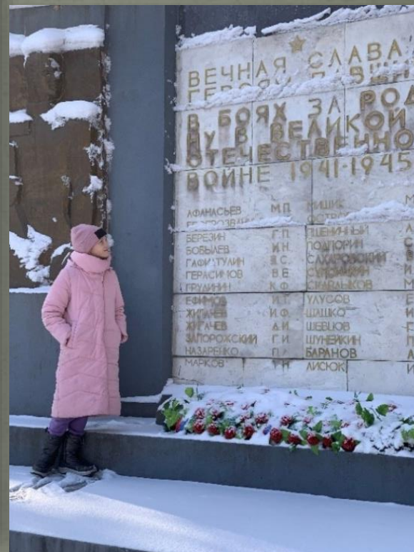
МЕМОРИАЛ СЛАВЫ ПОСВЯЩЕННЫЙ РАБОТНИКАМ КИРПИЧНОГО ЗАВОДА