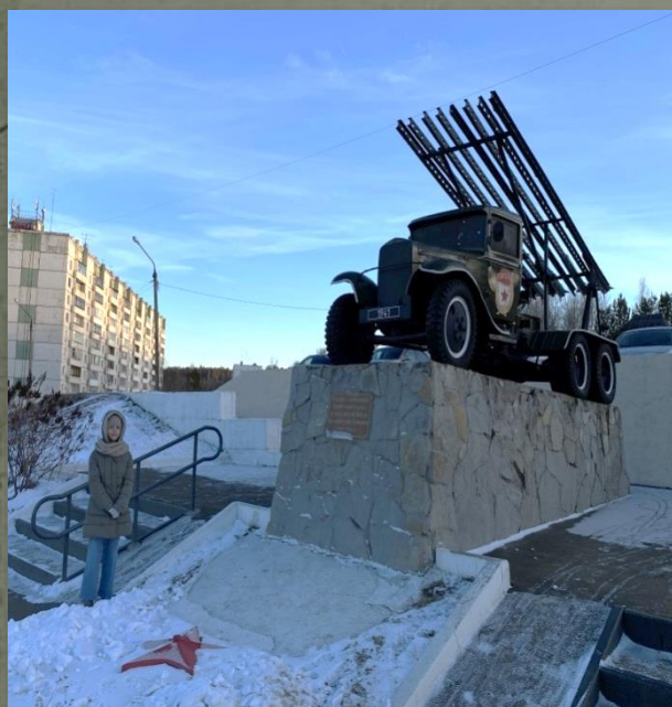
МЕМОРИАЛ ВОЕННОЙ СЛАВЫ И ДОБЛЕСТИ «КАТЮША»