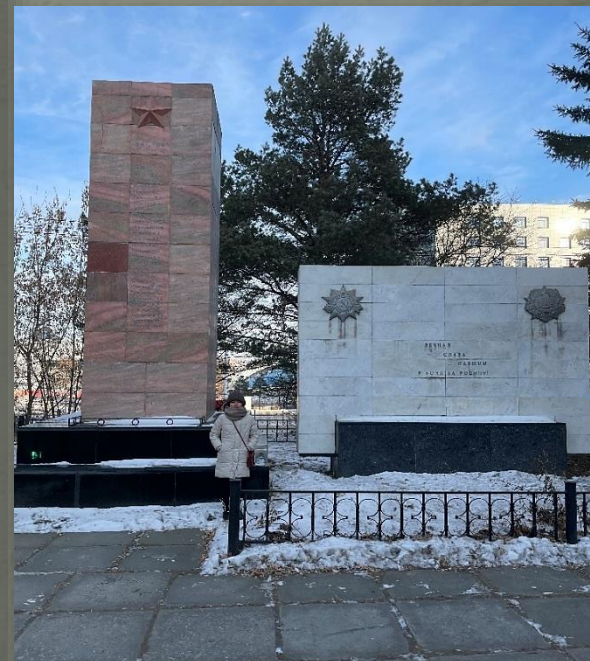
МЕМОРИАЛ СТУДЕНТАМ И ПРЕПОДАВАТЕЛЯМ ИГУ, ПОГИБШИМ В ГОДЫ ВЕЛИКОЙ ОТЕЧЕСТВЕННОЙ ВОЙНЫ