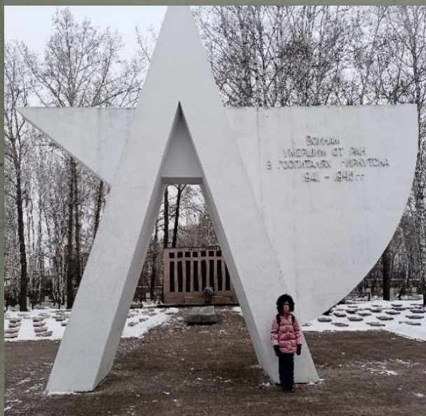
МЕМОРИАЛЬНЫЙ КОМПЛЕКС УЧАСТНИКАМ ВЕЛИКОЙ ОТЕЧЕСТВЕННОЙ ВОЙНЫ, УМЕРШИМ ОТ РАН В ГОСПИТАЛЯХ Г. ИРКУТСКА 1941-1945 ГГ.