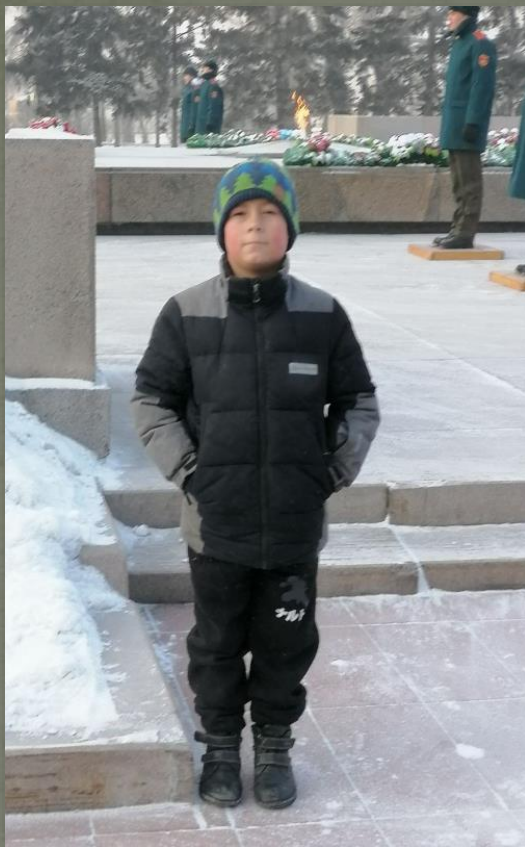
МЕМОРИАЛЬНЫЙ КОМПЛЕКС «ИРКУТЯНЕ В ГОДЫ ВЕЛИКОЙ ОТЕЧЕСТВЕННОЙ ВОЙНЫ 1941–1945 ГГ.»