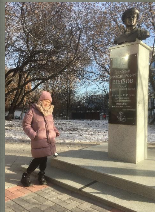
ПАМЯТНИК-БЮСТ НИКОЛАЮ ВИЛКОВУ