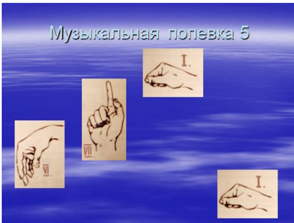
Рис.6 показ ручными знаками VI-VII-I-I

Вначале, прежде чем приступить к знакомству с правилами игры, имеет смысл повторить с детьми название клавиш на клавиатуре фортепиано, их соответствие названиям нот. Тем, кто не знаком с ними, объяснить, где находятся ноты до – си первой октавы, а также выше и ниже их. Далее дети по слуху определяют нажатую педагогом клавишу и самостоятельно находят её на клавиатуре фортепиано.