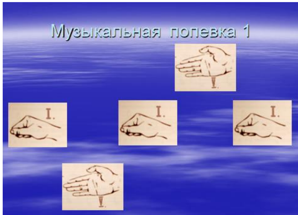
Рис. 2 показ ручными знаками I-V-I-V-I