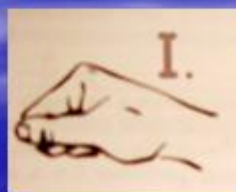
Рис. 4 показ ручными знаками III-II-I