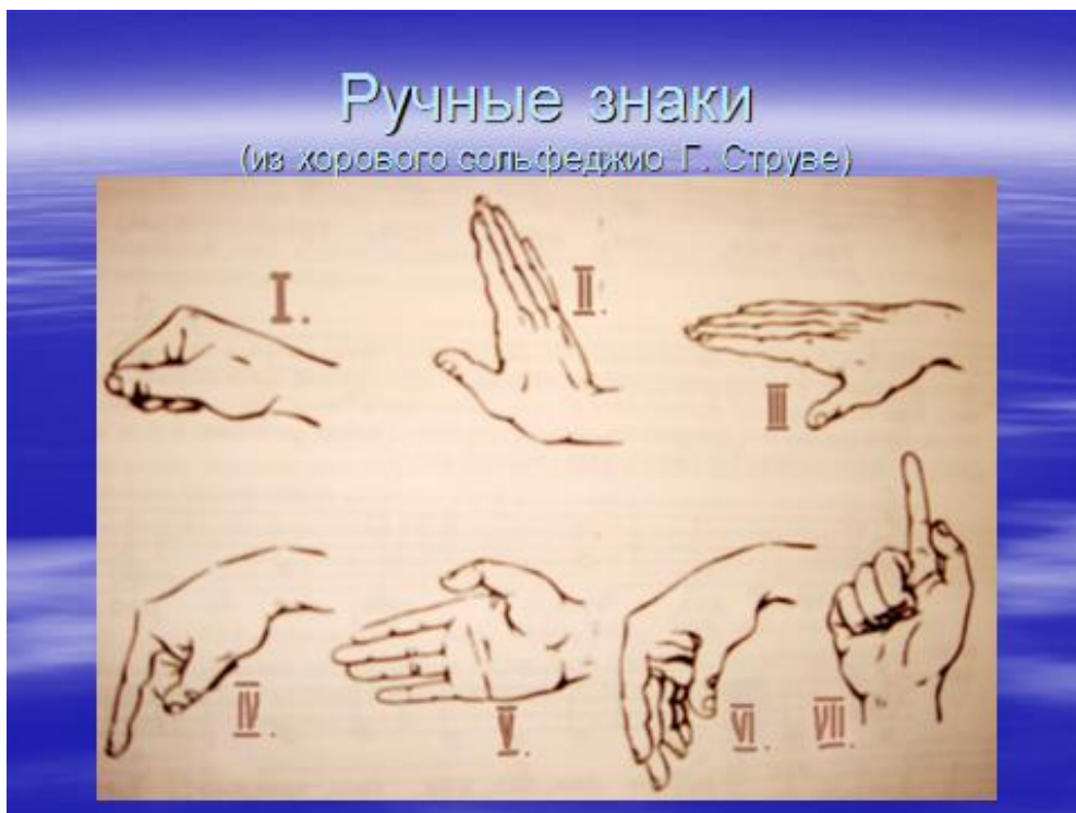
Рис. 1 ручные знаки семи ступеней лада по методике Г. Струве

Затем учащиеся вместе с педагогом их пропевают по слуху. После этого исполняют эти же попевки с использованием ручных знаков, изученных заранее в разделе хорового сольфеджио. Описание ручных знаков можно найти в «Хоровом сольфеджио» Г. Струве [5, с 5].