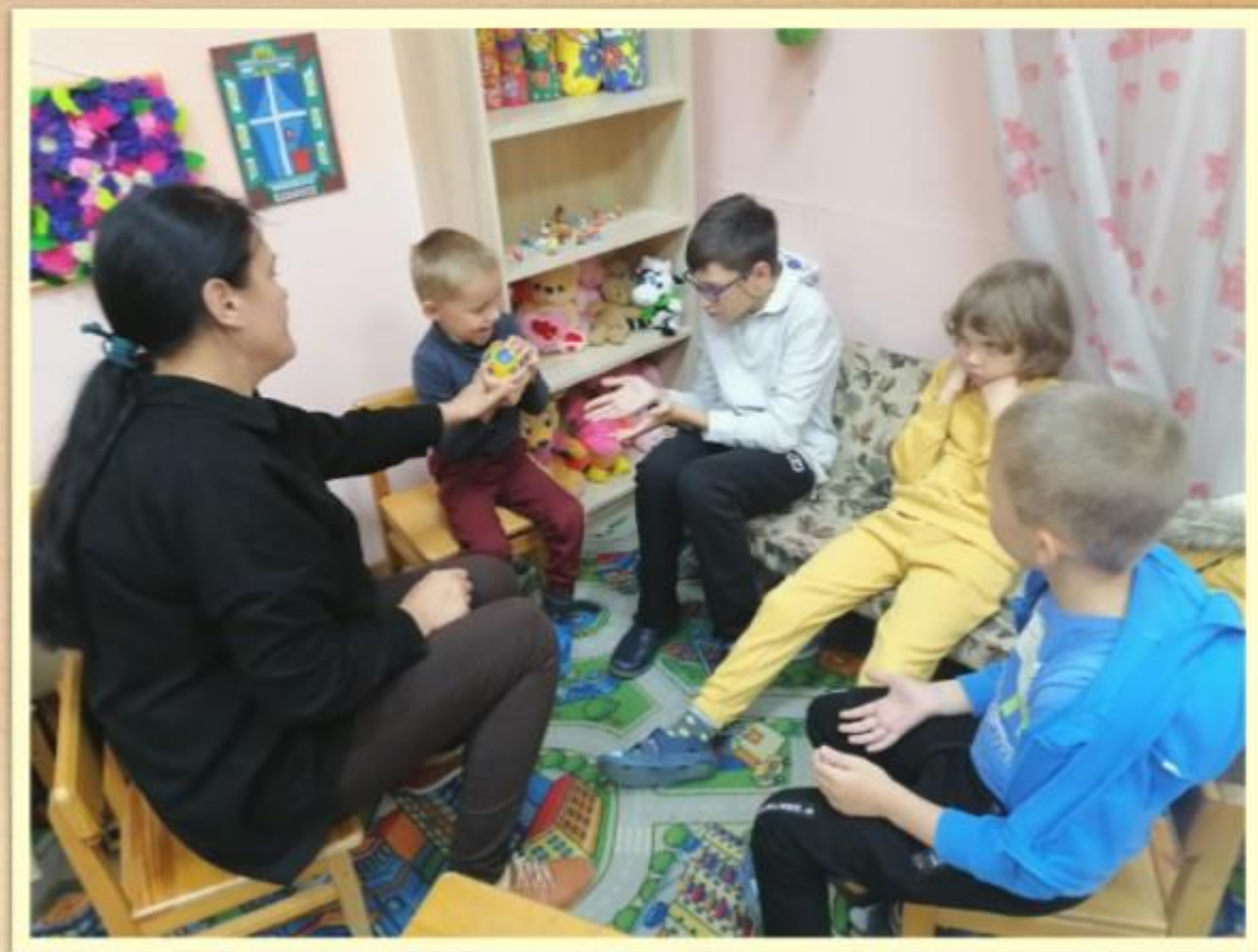
Мяч по кругу