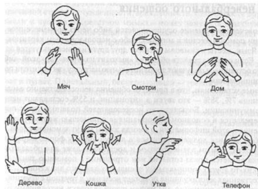
Рис. 22. Примеры простых жестов