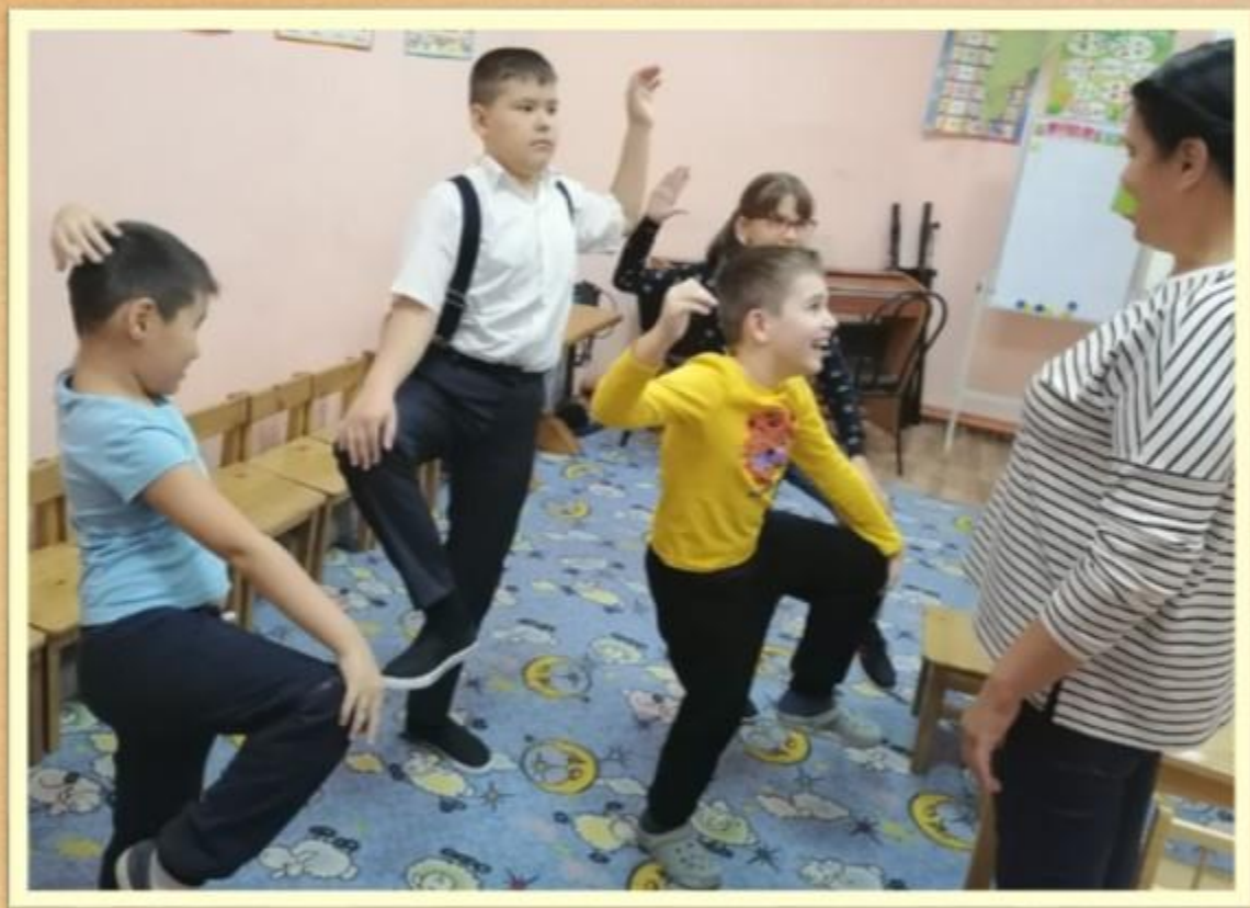
Игры на подражание