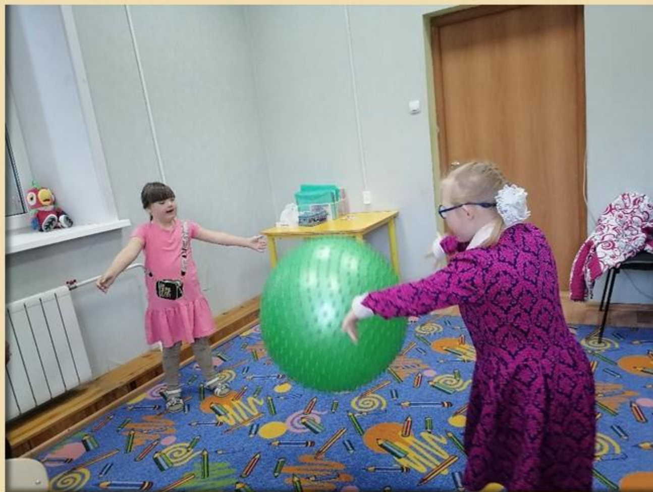
Игра в мяч