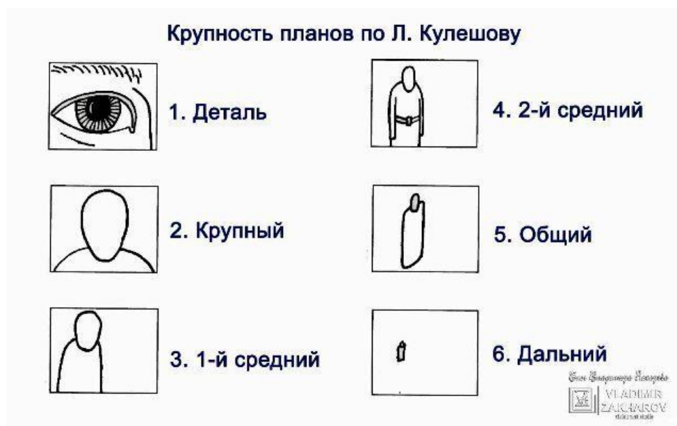
Таблица 2. Крупность планов по Льву Кулешову